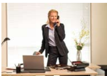
Des bureaux entièrement équipés