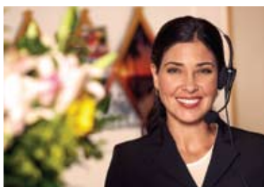
Une réceptionniste pour accueillir vos visiteurs