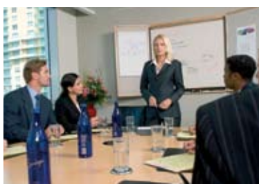
Des salles de réunion adaptées à vos besoins

Pour plus d'informations, appelez-nous au 0 800 023 077 ou par email : Lyon.PartDieu@regus.com